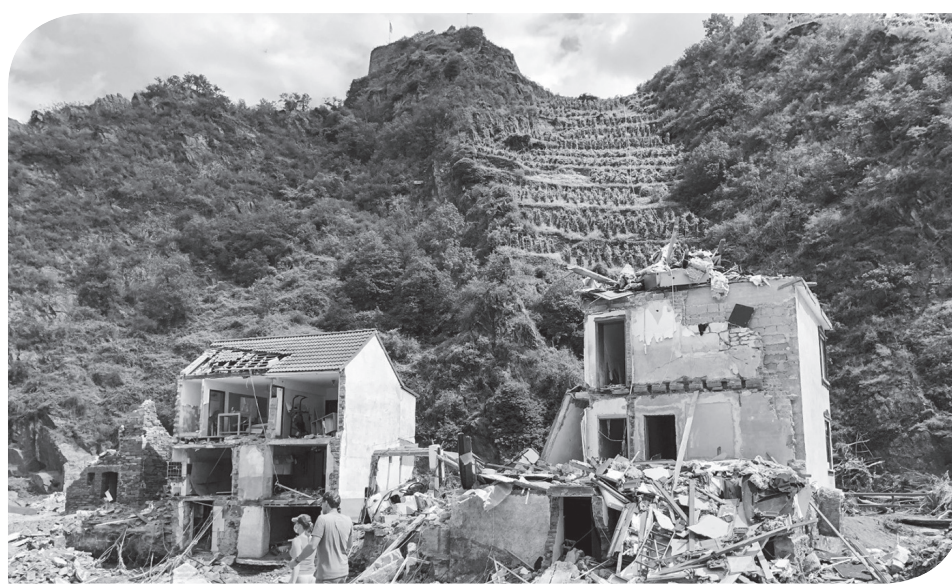
BENCANA BANJIR DI MAYSCHOSS - JERMAN

Menurut Pusat Pengendalian dan Pencegahan Penyakit (CDC), sekitar 163,8 juta orang di Amerika Serikat divaksinasi penuh dari populasi sekitar 330 juta. ● gul