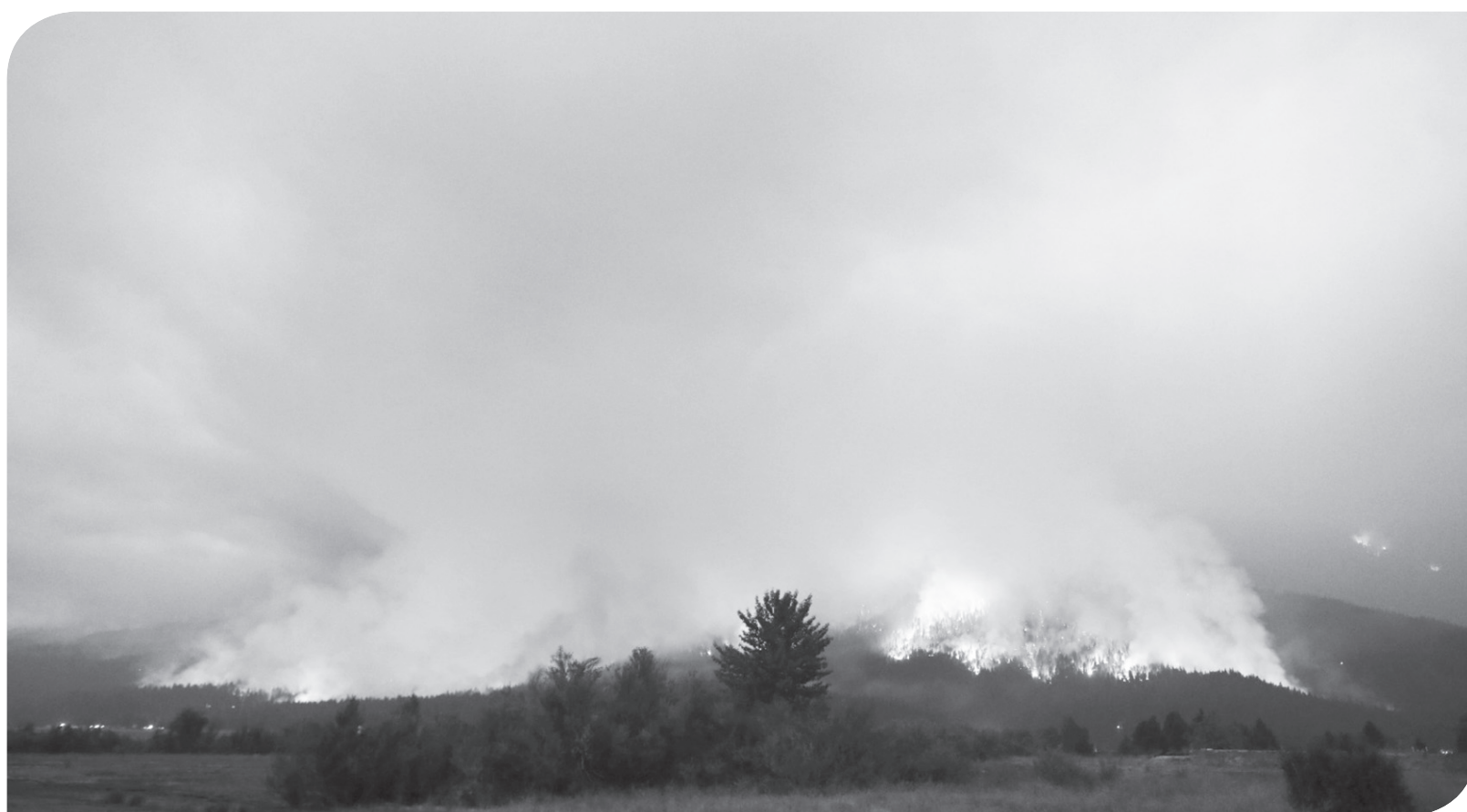
KEBAKARAN HUTAN DI CALIFORNIA - AS

Kebakaran hutan terjadi di Dixie di dekat Taylorsville, California, Amerika Serikat, Kamis (29/7).